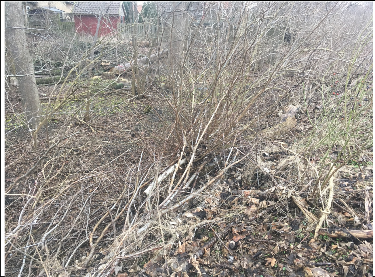
Billede 3: Grøften som den ser ud i dag