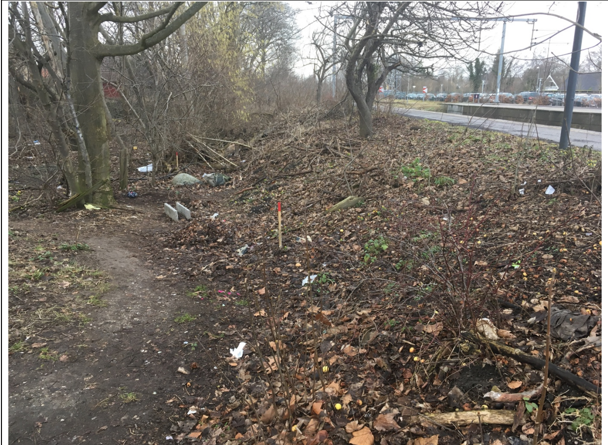
Billede 2: Grøften som den ser ud i dag