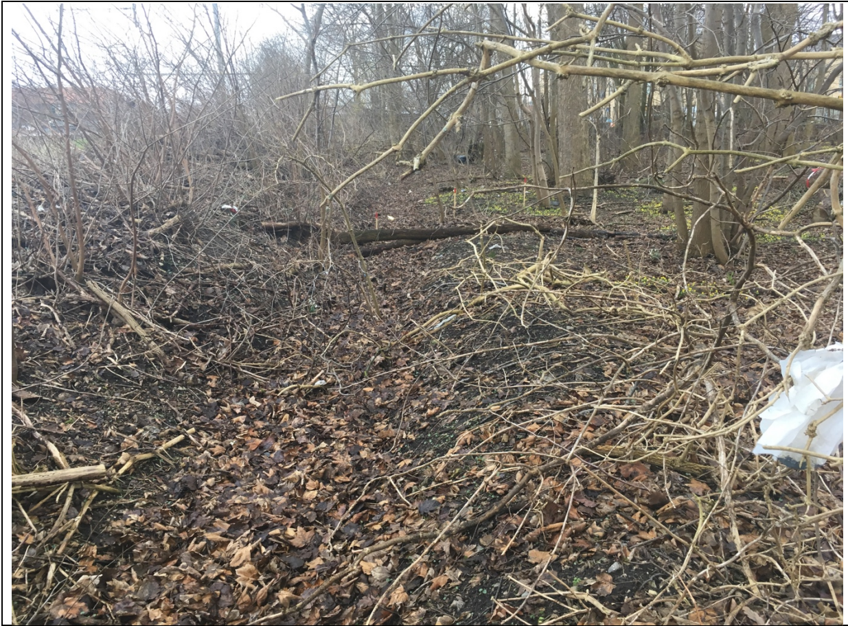
Billede 4: Grøften som den ser ud i dag